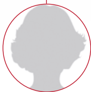
Nicole Vögel-Pousaz angestellt seit dem 1. April 2013 als Reinigungsfachfrau